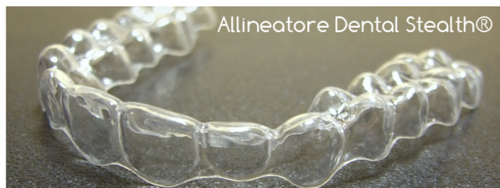
Allineatore Dental Stealth®

Maskerinat transparente Dental Stealth® janë plotësisht transparente dhe nuk kanë rriga ne sipërfaqen e tyre, të cilat mbajnë pllakat bakteriale.